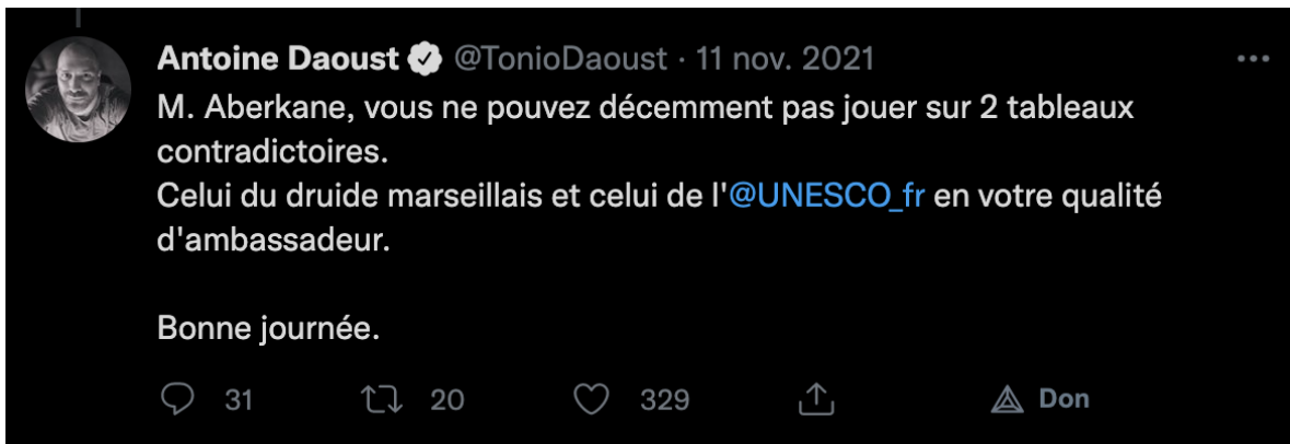
Figure 1: (Ou plutôt : Délire 1). Déclaration diffamatoire affirmant usurpation d'un statut diplomatique. Cette déclaration n'a jamais été ni rétractée, ni fait l'objet d'excuses. Laissons de côté la vague insulte enfantine envers le Professeur Raoult, la debunker serait tirer sur l'ambulance du jargon gamin de son auteur.